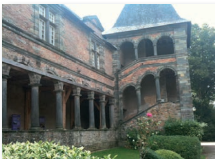
Journée culturelle pour nos Anciens autour des reliques du cœur d'Anne de Bretagne exposées actuellement au château de Châteaubriant.

Ce château bénéficie d'un projet de restauration par le conseil général de Loire atlantique. Il abrite notamment une galerie Renaissance. L'après-midi s'est déroulée dans la bonne humeur générale, le petit groupe s'étant déjà rencontré l'année précédente à Caen. Prochaine sortie : peut-être en Bretagne sur la Vilaine.