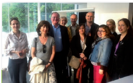
Le lieu d'Europe de Strasbourg a livré ses richesses en exclusivité aux Anciens de l'Association avant son ouverture officielle au printemps 2014.