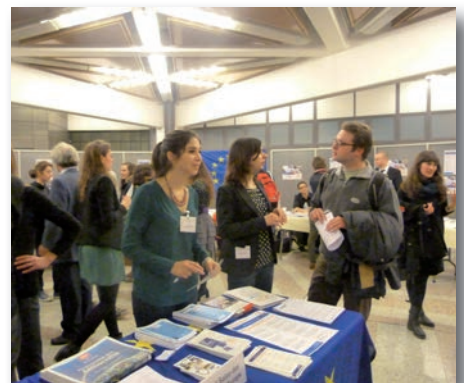
Le premier salon des métiers de l'Europe organisé à Strasbourg a remporté un vif succès auprès des étudiants de l'IEP qui ont également fêté les 20 ans de l'existence de leur master.

Les 22 et 23 novembre, les Anciens du Master Europe de l'IEP ont fêté les 20 ans de ce diplôme d'excellence sur les affaires européennes, en organisant le premier Salon des métiers de l'Europe au Palais des congrès de Strasbourg, accompagné par un colloque sur la formation aux métiers de l'Europe proposé par l'équipe pédagogique du Master. Ils se sont ensuite retrouvés pour une soirée festive très réussie qui a permis à tous de (re)nouer des contacts aussi bien amicaux que professionnels. La valorisation de ce parcours reconnu dans le monde européen (en 1993, il s'agissait du premier diplôme généraliste créé sur ce sujet) va se poursuivre avec d'autres actions. Plus d'infos sur www.metiers-europe.fr