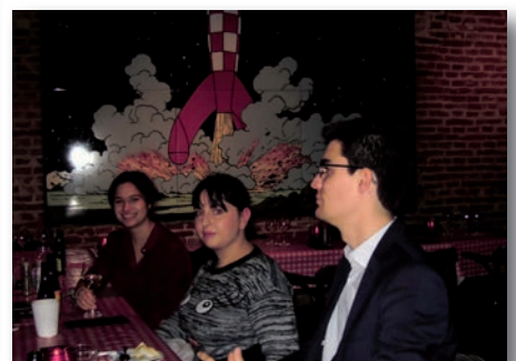
Bruxelles, ville au fort potentiel d'attractivité pour nos Anciens devient un repère incontournable pour les rencontres mensuelles !