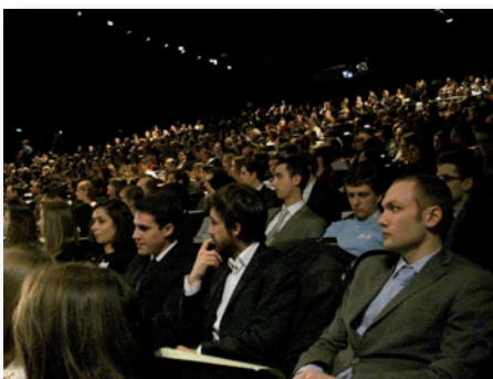
Plus de 200 promus et leurs familles ont fait salle comble pour la traditionnelle cérémonie des diplômes.

Salle comble pour les nouveaux diplômés de 2013... et pour la remise du trophée du "Sciences Po de l'année"