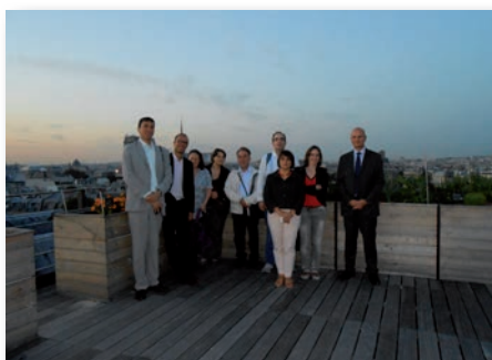
Délocalisation du stamm parisien pour une vue imprenable sur les toits de Paris après avoir visité la "Maison de la Mutualité", entièrement rénovée par GL Events, leader mondial de l'évènementiel prestigieux.

N'oubliez pas de nous communiquer votre adresse e-mail afin que nous puissions vous envoyer les invitations !