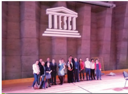
Quelques Anciens ont vécu un dépaysement culturel en territoire international !

En octobre dernier, un groupe d'Anciens a eu l'opportunité de visiter le siège de l'UNESCO à Paris. Cette organisation est particulièrement connue pour sa protection des patrimoines mondiaux. Mais elle est aussi une institution internationale de premier plan rassemblant plus de 190 pays. Près de 600 fonctionnaires travaillent dans le siège central parisien dans des bâtiments construits par les plus grands architectes. Les locaux et le parc concentrent des œuvres d'art du monde entier. Ce voyage en territoire international a permis, à tous, un dépaysement culturel en toute convivialité. Une expérience à renouveler !