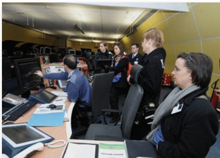
Une quinzaine d'Anciens a eu le privilège de pénétrer dans cette antre militaire, tous désireux de découvrir tous les secrets de surveillance de notre espace aérien.

Les Anciens ont eu l'occasion de visiter le Centre de détection et de contrôle de la Base aérienne de Drachenbronn le 20 novembre. Situé dans un ouvrage de la ligne Maginot, ce centre surveille la circulation aérienne militaire de tout le Nord de la France, et contrôle les engins non identifiés, jusqu'à faire décoller, si besoin, des chasseurs d'interception. Cette visite exceptionnelle sera renouvelée au printemps 2014.