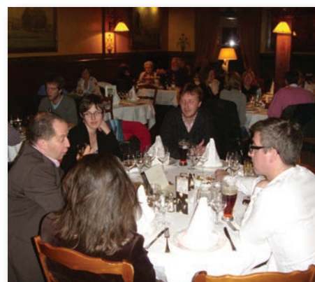
Le Stamm de Paris, rendez-vous incontournable pour les parisiens qui se donnent rendez-vous pour un repas convivial autour de spécialités alsaciennes. Quoi de mieux pour se rappeler sa vie d'étudiant(e) en Alsace !

Une ambiance toute alsacienne pour le dernier Stammtisch parisien de l'année. Amer bière, choucroute et vin blanc d'Alsace mais aussi de nouvelles idées d'activités étaient au menu de cette rencontre mensuelle entre Ancien(ne)s à la brasserie Bofinger.